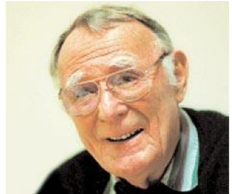
Основатель ИКЕА Ингвар Кампрад

Начав бизнес в 1943 году, ИКЕА выросла в глобальную сеть мебельных магазинов, построенную на единой концепции: «предлагать широкий ассортимент мебели и аксессуаров для дома хорошего дизайна и функциональности по ценам, доступным большинству людей».